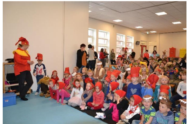
Alle leerlingen genieten van de voorstelling in het speelokaal

Na een aantal weken flink oefenen, was het vorige week woensdag zover: de voorstelling van het Sprookjesproject! Alle kinderen vonden een plekje in het speelokaal, dat met de schuifwand open, genoeg plek bood aan alle leerlingen van de school. Juf Janna had een leuk verhaal geschreven, waarin een aantal sprookjes uit het sprookjesboek was gevallen en via een optreden hun plekje in het boek terug moesten zien te krijgen. Wat een leuke en gevarieerde optredens waren er te zien! Dans, muziek, zang, drama, mooie kostuums en decors...er viel een hoop te genieten. In iedere klas waren alle sprookjes van de andere groepen ook voorgelezen, wat voor veel herkenning bij de kinderen zorgde.