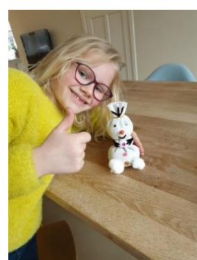
Sneeuwpop opdracht groep 4