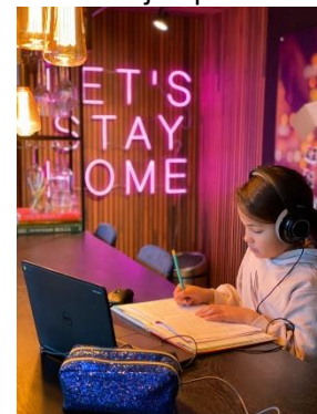
Luna (Let's stay home!)