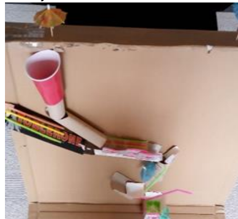
groep 8a: maak een knikkerbaan